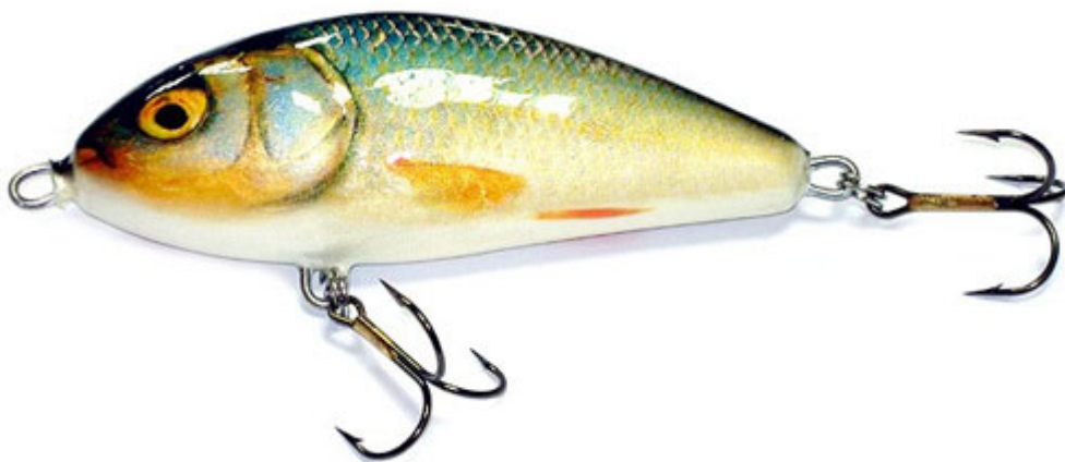
Le coloris "Real Roach" du Salmo Fatso est une imitation très réussie de poisson fourrage.