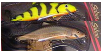
Salmo Skinner en coloris "Real Roach" et "Green Tiger".

Bonne nouvelle, le matériel gros jerkbait est aussi adapté aux gros poissons-nageurs ainsi qu'aux hybrides jerkbait/crankbait. C'est le moment de sortir de votre boîte à leurres le gros SALMO Fatso flottant. Bien que pouvant s'utiliser comme un pullbait (à la différence près qu'il effectue alors un rolling prononcé sur chaque tirée), il s'avère également très attractif en lancer-ramener malgré son absence de bavette : il déplace autant d'eau qu'un gros poisson-nageur tout en affichant une nage plus naturelle, pas du tout saccadée. Le ZALT est lui aussi un hybride jerkbait/crankbait efficace et renommé, supportant très bien une récupération rectiligne ponctuée de coups de scion. Chez SALMO, vous trouverez toute une gamme de gros poissons-nageurs qui gagnent à être animés par quelques tirées et coups de scion : le calme Warrior Crank, l'agressif Skinner et l'imitationiste Pike 16 F. Pour les accros aux leurres de surface, le Fatso Crank est de la pure dynamite, produisant un véritable raz-de-marée en surface ! Enfin, FOX possède également quelques monstroplantes à bavette à son catalogue, tel le FOX Warrior.