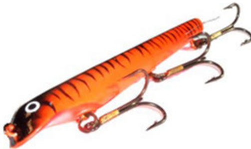
Le Suick, le plus célèbre des pullbait, et sans doute l'ancêtre des jerkbait !