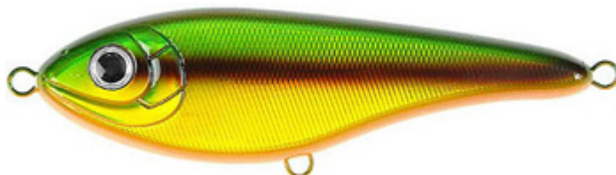
Idéal pour débiter, le Buster Jerk de Strike Pro est un glider d'une efficacité redoutable.