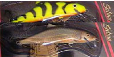
Salmo Skinner en coloris "Real Roach" et "Green Tiger".

Bonne nouvelle, le matériel gros jerkbait est aussi adapté aux gros poissons-nageurs ainsi qu'aux hybrides jerkbait/crankbait. C'est le moment de sortir de votre boîte à leurres le gros SALMO Fatso flottant. Bien que pouvant s'utiliser comme un pullbait (à la différence près qu'il effectue alors un rolling prononcé sur chaque tirée), il s'avère également très attractif en lancer-ramener malgré son absence de bavette : il déplace autant d'eau qu'un gros poisson-nageur tout en affichant une nage plus naturelle, pas du tout saccadée. Le ZALT est lui aussi un hybride jerkbait/crankbait efficace et renommé, supportant très bien une récupération rectiligne ponctuée de coups de scion. Chez SALMO, vous trouverez toute une gamme de gros poissons-nageurs qui gagnent à être animés par quelques tirées et coups de scion : le calme Warrior Crank, l'agressif Skinner et l'imitationiste Pike 16 F. Pour les accros aux leurres de surface, le Fatso Crank est de la pure dynamite, produisant un véritable raz-de-marée en surface ! Enfin, FOX possède également quelques monstroplantes à bavette à son catalogue, tel le FOX Warrior.