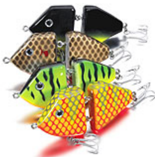
Brochette de FOX Micro Jointed Runt.

Ce jouet psychédélique est une tuerie totale, animé en tirées latérales rapides et en twitching. Ebouirifant !