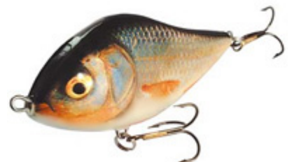
Le jerkbait Salmo Slider 12 coloris "Real Roach".

C'est adapté au Brochet (CQFD) ! Notre Brochet national est bien connu pour être par nature un carnassier plutôt fainéant, qui régule les populations de blancs en éliminant les sujets faibles, et contribue à assainir l'écosystème en s'attaquant à des proies malades qui sont aussi les plus faciles à attraper. Ceci gardé dans un coin de notre cerveau, comparons la nage d'un poisson nageur japonais comme le Lucky Craft B'Freeze à celle d'un gros jerkbait comme le Salmo Slider. Le B'Freeze est de silhouette modeste, possède une action nerveuse, émet de fortes vibrations, produit des effets sonores importants, et affiche des décorations clinquantes ou chatoyantes... Un véritable alevin sous cocktail d'amphétamines et d'ecstasy ! Sans lui retirer de son efficacité, il est clair que ce sont autant de caractéristiques qui à priori sont à milles lieux de constituer une proie toute désignée pour un Brochet cherchant à se remplir la panse au moindre effort. Le Slider quant à lui possède une silhouette imposante, une nage désordonnée et aléatoire, plus calme et plus ample, qui déplace de l'eau sans émettre de vibrations agressives, et affiche des coloris plus vrais que nature. Bref, il donne l'image d'une grosse proie entrain de passer de vie à trépas, une proie facile à engloûtir, une proie... toute désignée pour Esox !