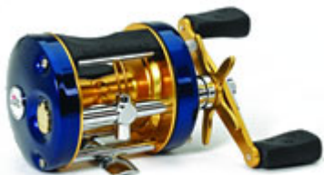
Abu Garcia Ambassadeur Classic : une fiabilité éprouvée.

Caractéristiques techniques : 3 roulements à billes minimum ; une capacité de + de 100m de nylon 35/100 ou de tresse 25/100 ; un poids inférieur à 400gr ; un bâti de préférence en aluminium pour la robustesse ; un frein puissant et fiable, situé de préférence à l'avant pour un gain de poids.