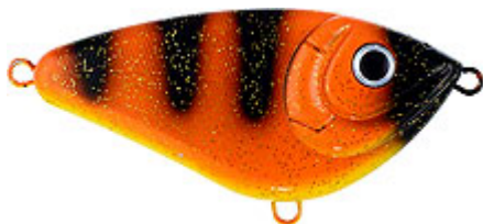
Strike Pro Belly Buster.

Les modèles de forme très haute ou très ventrue sont généralement conçus pour effectuer des écarts latéraux rapides de faible amplitude ; comme le STRIKE PRO Belly Buster. Pour eux, une animation faite de coups de scions enchaînés rapidement, quasiment sans le moindre temps mort entre eux, sera généralement la plus adaptée. Elle donnera à votre glider la nage pour laquelle il a été conçu : une nage tout en zigzags serrés faite d'écarts très rapides, imitant ainsi l'allure d'un poisson affolé et désorienté.