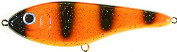
Strike Pro Buster Jerk coloris "Orange Tiger" bruyant et au coloris agressif, il ne passera inaperçu !