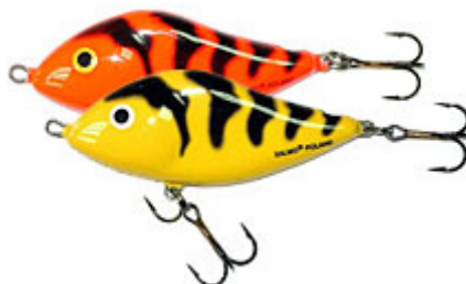
SALMO Sliders coloris Red et Yellow Tiger.