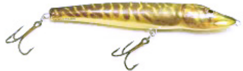
Le Salmo Jack en coloris "Pike", un jerkbait à la nage basique, imitant un brocheton.