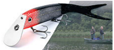
Le FOX Warrior et sa nageoire caudale souple.

« Et pour les vrais hommes, y'a quoi ? »