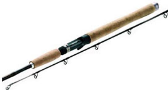
Rozemeijer 2 Jerk-It : légère, puissante ...la nouvelle référence.

QUANTUM Hypercast Jerk : 1,80m / 50-120gr / mono-brin / casting