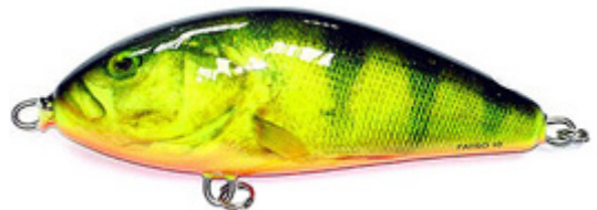
Le Salmo Fatso en coloris "Hot Perch", un coloris mi-imitatif / mi-excitatif.