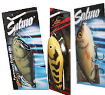
Brochette de Salmo Slider 10 et Fatso 10.

Vous trouverez ces bébés chez Franck'S ( www.franck-s.com ) ou chez Ulrich Beyer ( www.angel-ussat.de ).