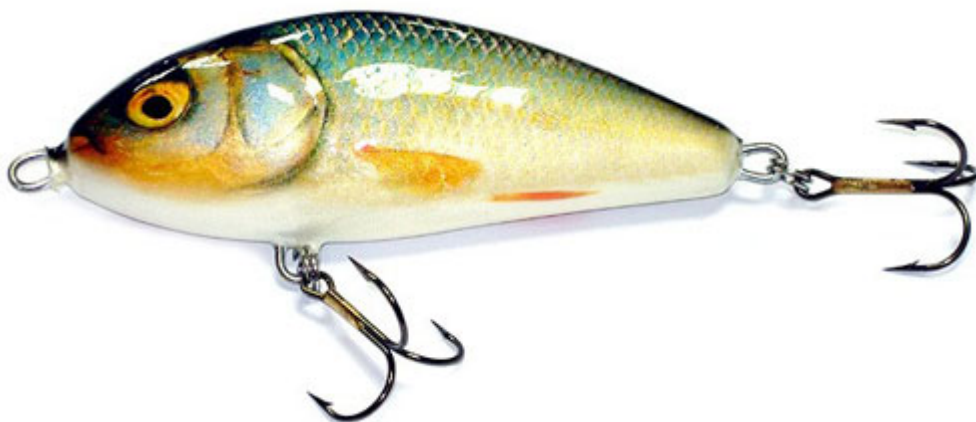
Le coloris "Real Roach" du Salmo Fatso est une imitation très réussie de poisson fourrage.