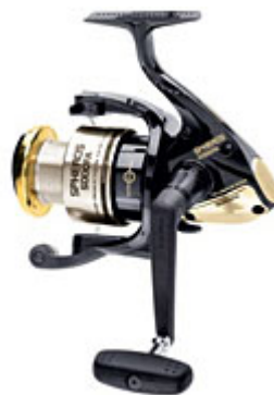
Shimano Spheros : un tambour fixe, mais... costaud !