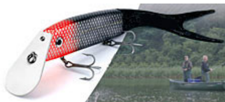
Le FOX Warrior et sa nageoire caudale souple.

« Et pour les vrais hommes, y'a quoi ? »